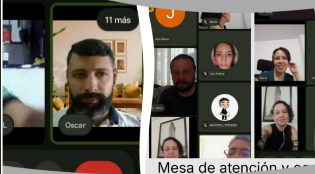
Mesa de atención y...

La jornada pedagógica como un espacio de análisis y reflexión del Proyecto Educativo Institucional (PEI), promoviendo la participación activa de todos. Se generaron aportes significativos que permitieron reflexionar sobre los procesos institucionales, las prácticas pedagógicas y las acciones para la actualización del PEI.